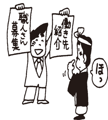
仕事対策・求人・求職も東京土建で

足立支部ではあくまでも情報提供のみとさせていただきます。契約内容等における責任は一切負いかねます。