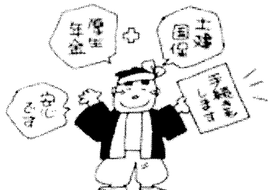
みんなで厚生年金の手続きも東京1区を通じて

古千谷・椿谷在家・血沼 東伊興・西伊興・島根・竹保・中央梅島 五反野・青井・花保東・平野 梅田・花畑・花保南 事業所