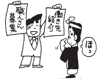
仕事対策・求人・求職も東京土建で