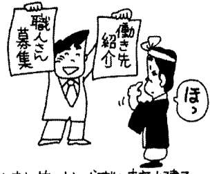
仕事対策・求人・求職も東京土建で