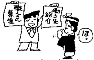
仕事対策・求人・求職も東京工建で

求人・求職情報について 当掲示につきましては、各自の責任におきましてご利用下さい。支部では、あくまで情報提供のみとさせていただきます。契約内容等における責任は一切負いかねます。