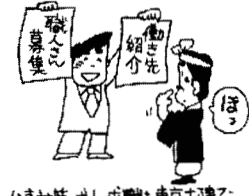
仕事対策 求人・求職も東京土建で