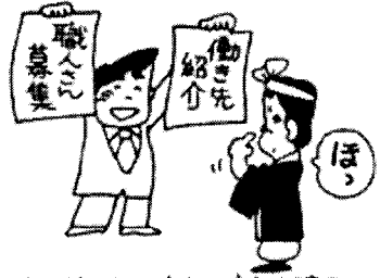
仕事対策・求人・求職も東京土建で

足立支部ではあくまでも情報提供のみとさせていただきます。契約内容等における責任は一切負いかねます。