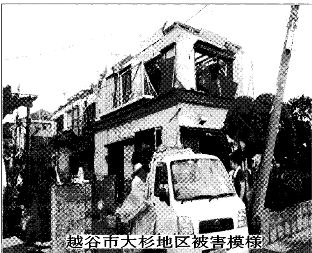
越谷市大杉地区被害模様

「足立区公契約条例」を区長提案することが確認されました。いよいよ条例制定まであと一歩です。今後議会傍聴などを通じて、さらに議会世論を盛り上げます。 また条例制定とともに「足立区労働報酬審議会」の設置と委員選出が大きな課題となります。建設従事者の声を代弁するため支部の委員選出をすすめます。