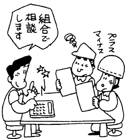
税金の相談も東京土建で