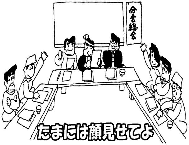
たまには顔見せてよ

住宅デーの協力者、参加者数は増えたか、分会組織数を増増させたかなど、一年の運動を振り返り、貢献してくれた仲間をねぎらいましょう。また反省点があれば次年度に活かす教訓として議論しましょう。