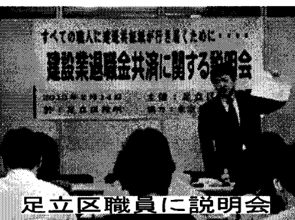
足立区職員に説明会

れば積立をすることができます。町場などの一人親方がこの制度を利用できるようになったのは、東京土建の組織力と運動が実ったからです。 但し、いずれの場合も加入後2年以内の解約では退職金が出ませんのでご注意ください。