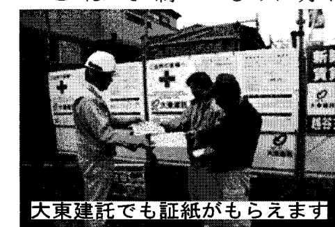
大東建託でも証紙がもらえます

「手帳はないが過去に働いていた建設会社が建退共に加入していた」そんな方はいませんか。特に公共工事を中心に働いていたなどの場合には、建退共に加入していただくことが判明するケースがあるかも知れません。