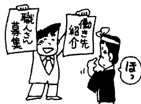
仕事村集 求人 求職も東京工建で

足立支部ではあくまでも情報提供のみとさせていただきます。お問い合わせは、 契約内容等における責任は一切負いかねます。