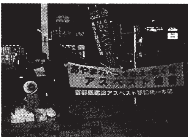
▲毎月、行われる駅頭宣伝行動

389人が提訴し、足立支部の 組合員と遺族は39人と最大です。 しかし、すでに七年の歳月が経 ち123人（内足立支部4人） の方が亡くなられています。救 済は時間との勝負です。 石綿肺、中皮腫などの疾患で 気になることがあったら組合に 相談をして下さい。あわせて、 アスベストの被害救済を求める 『建設アスベスト早期解決を求 める200万人署名』の協力と 駅頭宣伝行動にも奮ってご参加 下さい。足立支部と一緒にがんば りましょう。