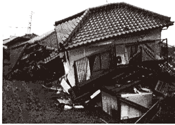
熊本県益城町の倒壊家屋

このたびの熊本・大分大地震で被害を受けられた皆様、組合員のご家族やご親族の皆様から心からお見舞い申し上げます。4月14日と16日に熊本県震源として発生したマグニチュード7.3地震は、その後も余震が続き全壊1174棟、死者49人を数える甚大な被害を与えています。熊本県では509箇所の避難所に39,702人（4月27日内閣府発表）となっています。組合では今月二つの取り組みを推進します。一つは足立区が行なっている減災助成制度の理解と普及、二つ目が熊本支援募金の取り組みとなります。