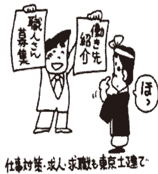
仕事対策・求人・求職も東京工連で

足立支部ではあくまでも情報提供のみとさせていただきます。契約内容等における責任は一切負いかねます。