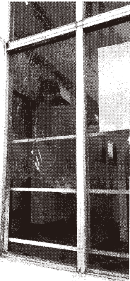
学校の窓ガラスが破損（イメージ）