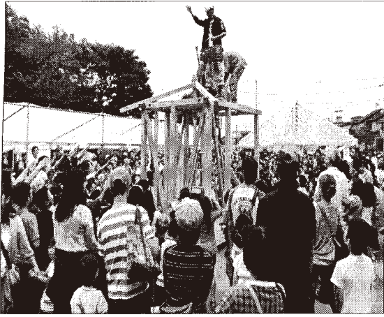
当日は、建前や各職種体験他、建設業の「技」と魅力を体験できる一日になります。