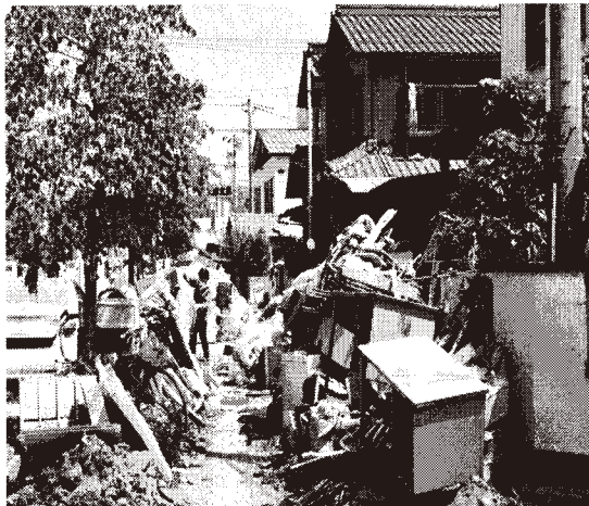
岡山県真備町がれき撤去の様子

東京土建と同様に西日本・四国地域には、岡山・広島・愛媛県建設労働組合があります。この猛暑の中、多くの仲間が苦しんでいます。（被害・被災状況は、確認中）