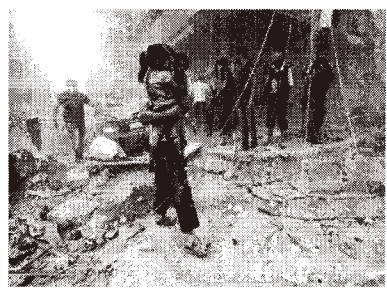
紛争中の街の様子

子育て世代や年齢層の若い組合員からの質問に「足立支部の運動の柱は、建設従事者の社会的地位向上や職人の賃金単価引き上げなのに、どうして建設労働組合なのに平和運動にそんなに力を入れるのですか?」と支部に寄せられます。その理由として大きく分けて2つの側面があります。①戦時中、技能提供で多くの建設労働者が戦争の犠牲になった。②平和の下でない運動が前進しない。この2点です。この歴史的反省を踏まえ、東京土建足立支部は平和運動に取り組んでいます。