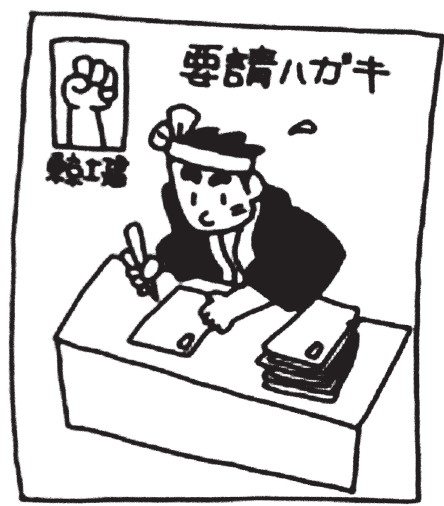
厳しいなか、運動の力で 概算要求は増額を勝ち取る

土建足立支部 足・梅島1-2-26 TEL5845-5011 FAX5845-5014 NO.498 毎月15日発行 2018/12/15