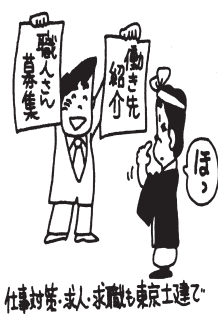
足立支部求人募集

足立支部ではあくまでも情報提供のみとさせていただきます。契約内容等における責任は一切負いかねます。