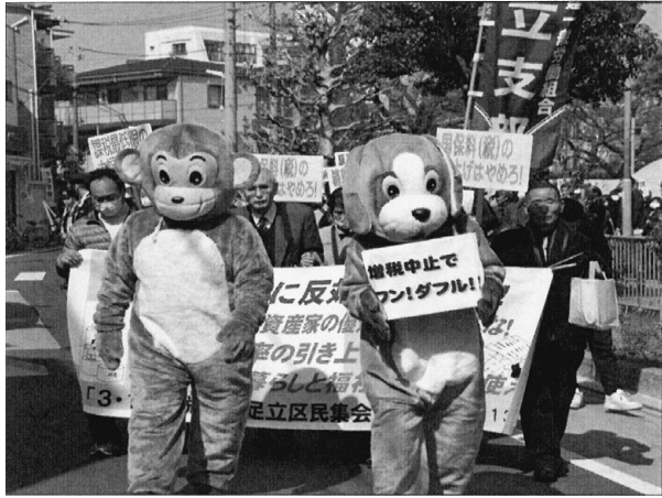
消費税増税反対を掲げ区民へ訴えるデモ行進写真は、2018年3月13日千住旭公園の様子。

記 日時：2019年4月7日（日） 会場：連合会館 代議員届締切：2019年3月26日（火）