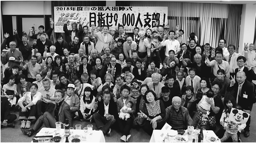
写真は、多くの仲間が参加した拡大出陣式の様子 (2018年4月13日)

仲間を増やす取り組みの春の拡大月間が4月1日からスタートしました。拡大月間は年間を通じて春と秋の季節に行います。今回の拡大月間は新しい仲間348人を目標に支部・分会が一枚岩となって5月末まで取り組みます。拡大統一行動日は7次行動8日間行動を提起し、分会役員を中心に組合員宅への訪問行動を展開します。訪問時間が夜間時の訪問となりますがご理解とご協力をお願いします。