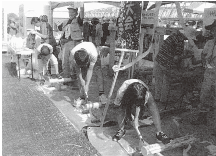
昨年の丸太切り大会の様子。今年は「竹切り大会」です。

【開催日時】：10月12日(土) (雨天決行) 13日(日) 各日共 11時～16時まで