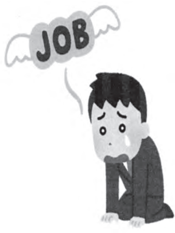
雇用保険（失業保険）

厚生労働省は毎年11月を労働保険強化月間と位置付けて、労働保険の加入促進を進めています。労働保険とは、労災保険（労働者災害補償保険）と雇用保険の2つを総称して読んでいます。以前から労働保険加入義務があるにも関わらず、未加入を続けている事業所があります。労働者を雇い入れたら、強制加入するのが労働保険！会社のため、労働者のために加入しましょう！