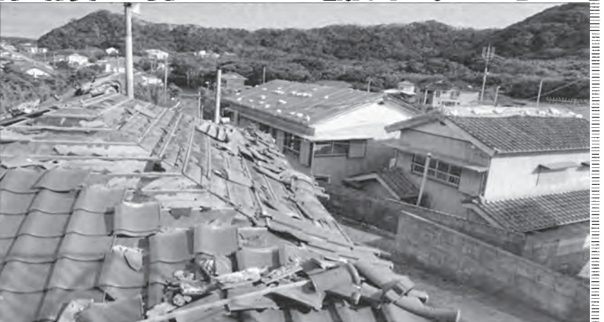
台風15号による被害（千葉県南房総市）

台風15号・19号・21号が東日本へ上陸し、甚大な被害が発生しました。災害支援を含めた年末募金活動とさせていただきます。募金袋は、各組合員に配布させていただきます、一人でも多くの仲間にご理解をいただきながら支援を募ります。今年は、2か月間にわたる取り組みとさせていただきます。